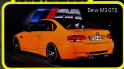
Bmw M3 GTS